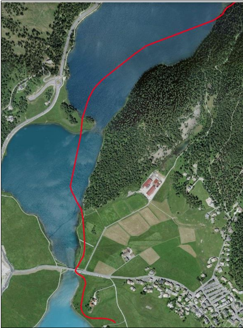
Distanzrennen (Etappe 3)